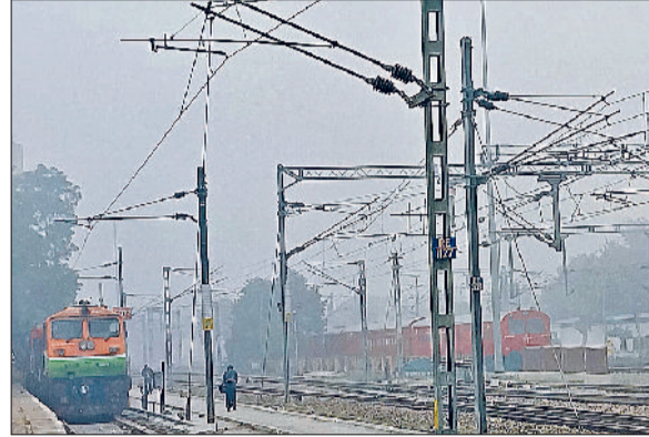
रेवाड़ी। मंगलवार को कोहरे में लिपटा रेलवे जंक्शन।

रबी की प्रमुख फसलों सरसों और गेहूं का विकास ठंड पर निर्भर करता है। बीते दिसंबर माह तक दिन के समय मौसम लगातार गर्म बना हुआ था, जिससे दोनों फसलों को नुकसान की आशंका बनी हुई थी। अब दिन का तापमान गिरने से दोनों फसलों को अच्छा फायदा होने की संभावना है। कृषि विशेषज्ञों के अनुसार किसानों को दोनों फसलों की नियमित रूप से हल्की सिंचाई करनी चाहिए, इससे जमीन का तापमान बढ़ेगा। पाला जमने की सूरत में किसानों को शाम के समय खेतों में धुआं करना चाहिए, ताकि पाला नहीं जमे। इस समय अगर बारिश होती है, तो वह दोनों फसलों के लिए कारगर साबित होगी।