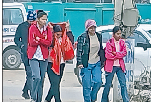
रेवाड़ी। मंगलवार को दिन के तापमान में कमी से बढ़ी टिडरन।

ठंड अपने पीक की ओर बढ़ने लगी है। दिन के तापमान में बड़ी गिरावट आने से टिडरन बढ़ गई है। ठंड के साथ कोहरे का प्रकोप जनजीवन को अस्त-व्यस्त करने लगा है। सड़कों पर जहां वाहनों की रफ्तार मंद पड़ गई, तो दूसरी ओर लंबी दूरी की ट्रेनों का संचालन काफी प्रभावित होने लगा है। जम्मू-तवी से बाड़मेर के बीच चलने वाली पूजा एक्सप्रेस ट्रेन को रद्द कर दिया गया। आने वाले दिनों में कोहरा और गहराने की आशंका जताई जा रही है। मंगलवार को सुबह से ही घना कोहरा छाया रहा। कई स्थानों पर कोहरे की विजिबिलिटी 30 से 40 मीटर ही रही। इससे सड़क यातायात बुरी तरह प्रभावित हुआ। दिल्ली-जयपुर नेशनल हाइवे पर वाहनों की लंबी कतारें लगी रहीं। वाहन चालक लाइट जलाकर एक-दूसरे के पीछे मंद गति से चलते रहे, जिससे उन्हें गंतव्य तक पहुंचने में काफी समय लगा। यह नेशनल हाइवे काफी व्यस्त है, जिस कारण वाहनों की लंबी लाइनें लग जाती हैं। मंगलवार का दिन सर्दी के सीजन का सबसे ठंडा दिन रहा। अधिकतम तापमान 5.0 डिग्री सेल्सियस की गिरावट के साथ 13.0 डिग्री सेल्सियस पर आ गया।