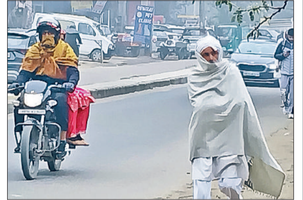
रेवाड़ी। टिडरन से बचाव के साथ बावल रोड से गुजरते लोग।

कोहरा गहराने का असर रेल यातायात को बुरी तरह प्रभावित करने लगा है। पैसेंजर ट्रेनों का संचालन लगभग सही समय पर हो रहा है, परंतु लंबी दूरी की ट्रेनों के देरी से चलने का सिलसिला शुरू हो गया है। मंगलवार को गुजरात के साबरमती से दिल्ली के बीच चलने वाली आश्रम एक्सप्रेस लगभग 2 घंटे की देरी से स्टेशन पर पहुंची। जम्मू-तवी व बाड़मेर के बीच चलने वाली पूजा एक्सप्रेस रद्द कर दी गई, जिससे रेल यात्रियों को भारी परेशानी का सामना करना पड़ा। गुज-बरेली एक्सप्रेस का दोनों ओर लगभग 45 मिनट की देरी से संचालन हुआ। लंबी दूरी की अन्य कई ट्रेनों का संचालन भी कोहरे से प्रभावित हो रहा है।