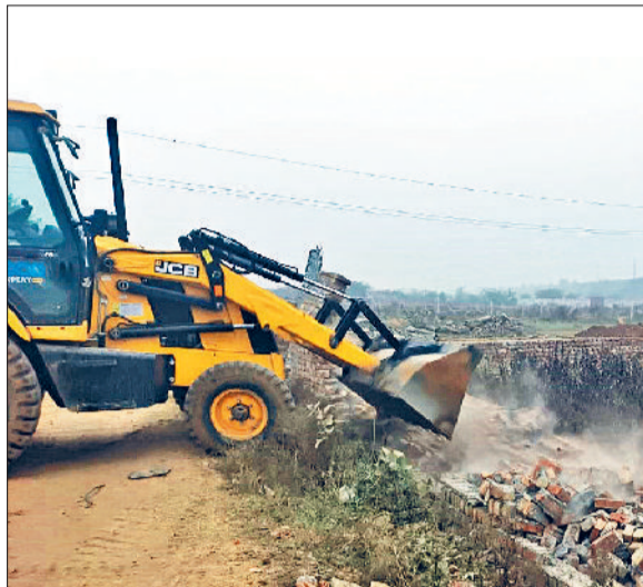
रेवाड़ी। नारनौल रोड तथा भाड़ावास रोड पर अवैध कॉलोनी का निर्माण तोड़ती जेसीबी।

सात एकड़ में विकसित हो रही दो कॉलोनी, प्रशासन की कार्रवाई से कॉलोनाइजर में मचा हड़कंप