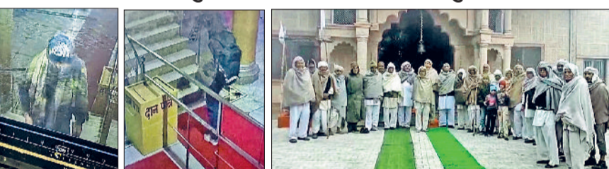
रेवाड़ी। सीसीटीवी में कैद चोर व मंदिर में दानपात्र के पास मौजूद चोर वारदात के बाद मंदिर के बाहर मौजूद ग्रामीण।

सीसीटीवी कैमरे में कैद हुई वारदात, ग्रामीणों में आक्रोश, पुलिस कर रही जांच